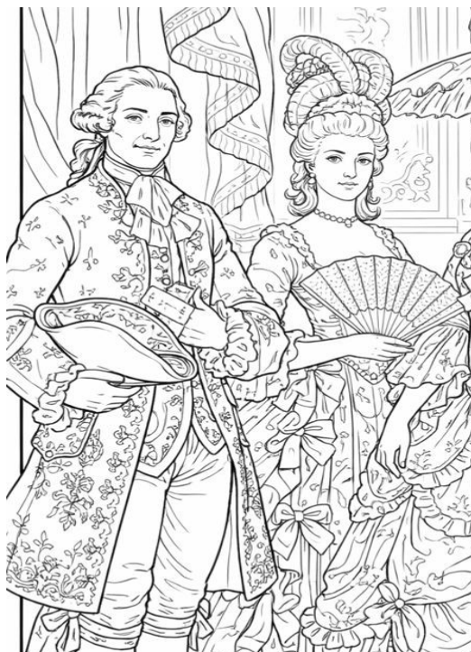
Segundo Estado - nobreza