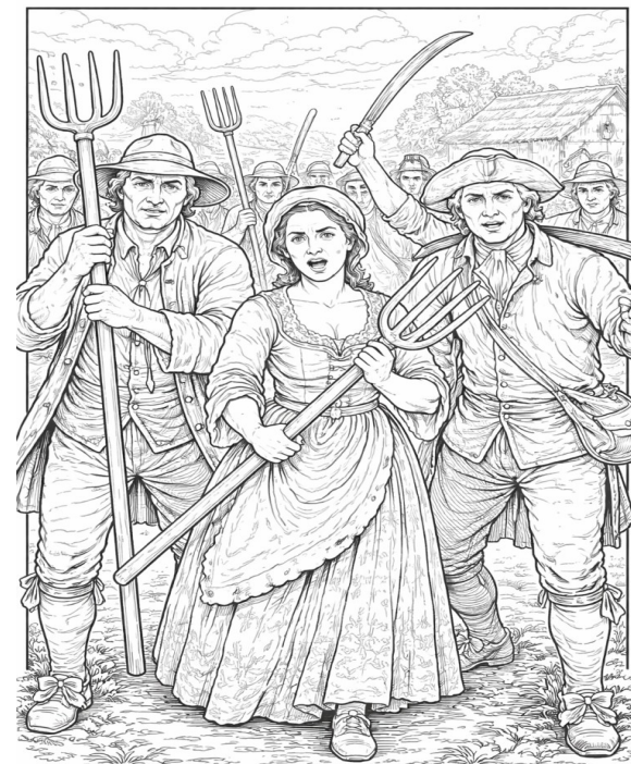
Terceiro Estado: camponeses, profissionais liberais, comerciantes, artesãos, etc