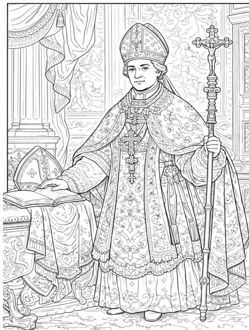
Primeiro Estado - clero