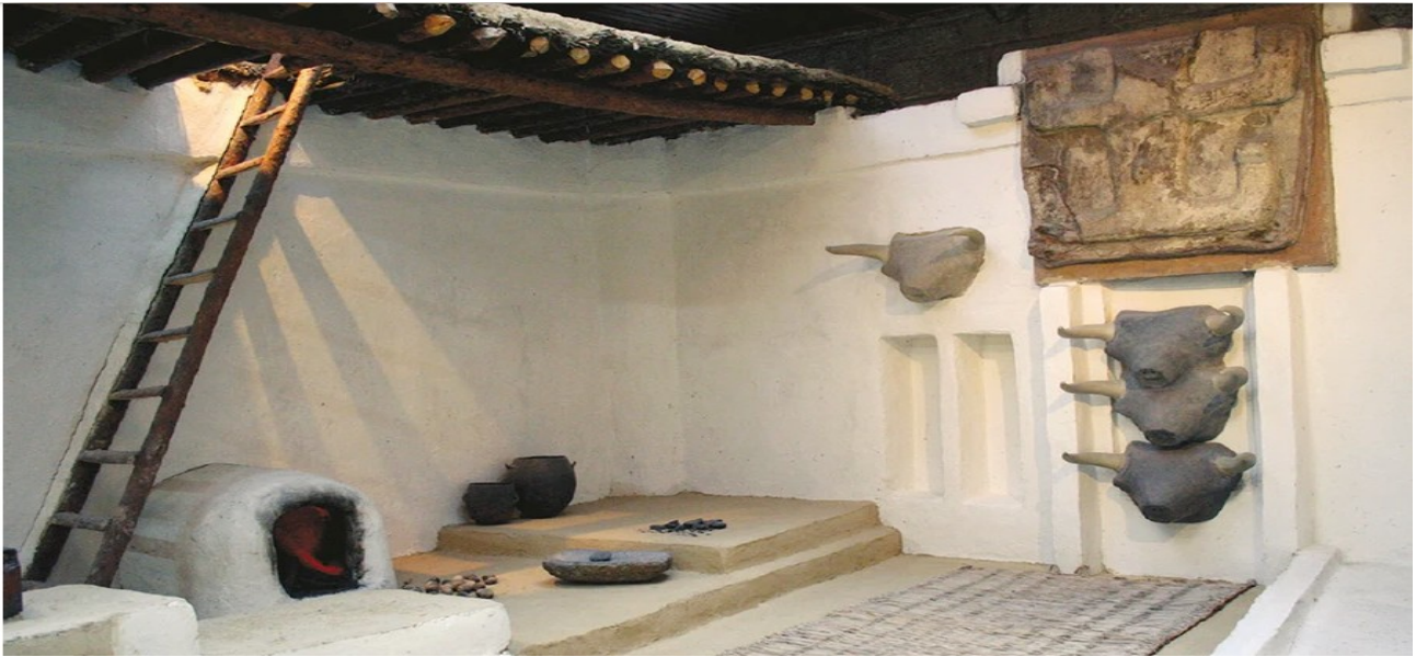
Reconstituição do interior de uma casa em Çatalhuyuk