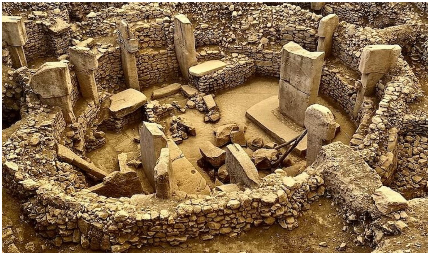
Foto atual do sítio.