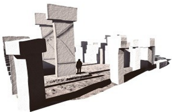
Reconstituições em computador de Gobleki Tepe