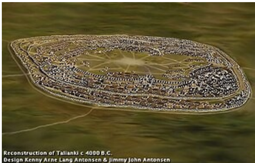
Reconstrução de Tjlanky, por volta de 4000 a.C.