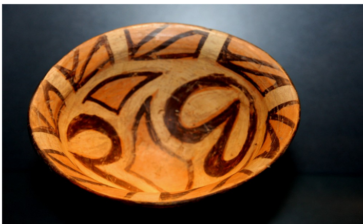
Vaso encontrado em Tajlanky