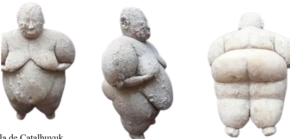
Figura de argila de Çatalhuyuk