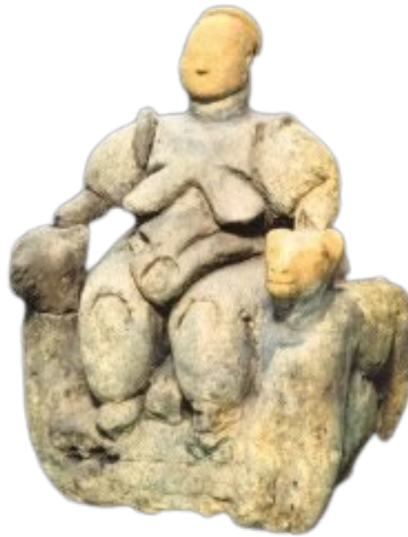
Figura de argila de Çatalhuyuk (A cabeça não é original)