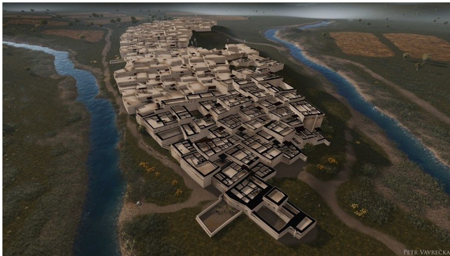
Reconstituição em computador de Çatalhuyuk