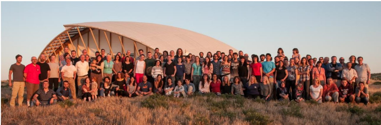
Arqueólogos do Çatalhuyuk Research Project