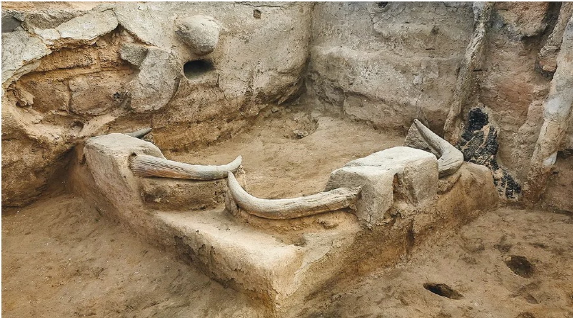
Casa escavada em Çatalhuyuk