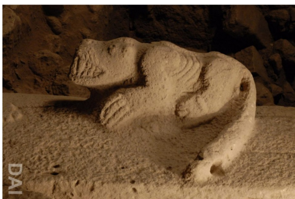
Animais gravados em pedra em Gobleki Tepe